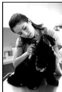
Le vétérinaire examine les oreilles d'un cocker.

Pour devenir docteur vétérinaire, il faut faire de longues études. Après le bac, il faut sept ans pour obtenir le diplôme. Il se prépare dans une des 4 écoles vétérinaire de Paris, Lyon, Nantes ou Toulouse.