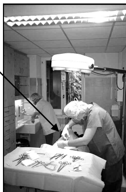
le vétérinaire opère Droopy.