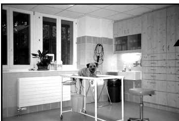
Droopy avant l'opération.